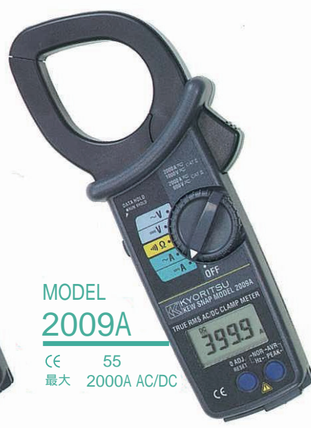
MODEL 2009A CE 55 最大 2000A AC/DC