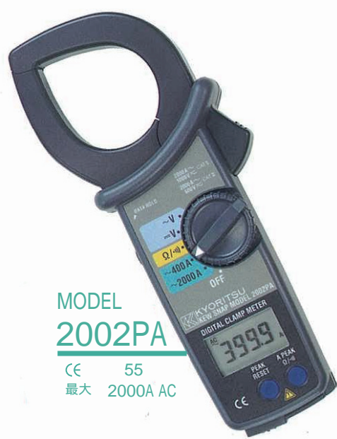
MODEL 2002PA CE 55 最大 2000A AC