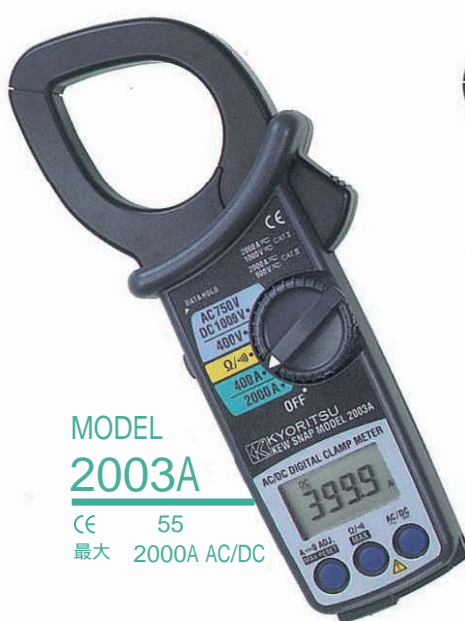
MODEL 2003A CE 55 最大 2000A AC/DC