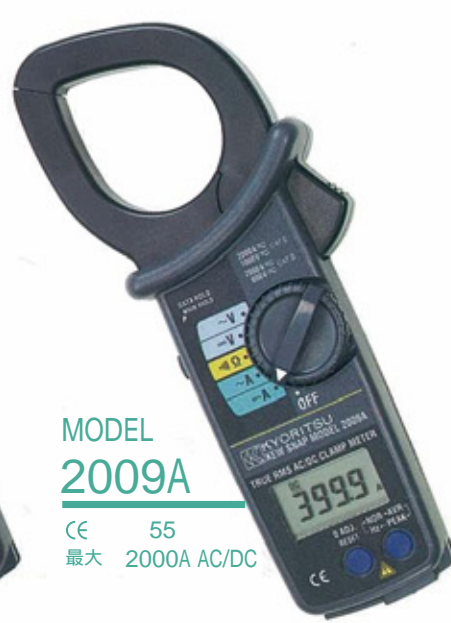
MODEL 2009A CE 55 最大 2000A AC/DC