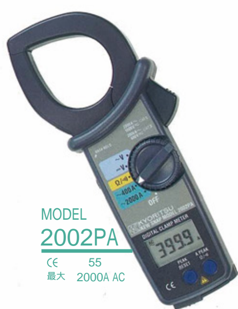
MODEL 2002PA CE 55 最大 2000A AC