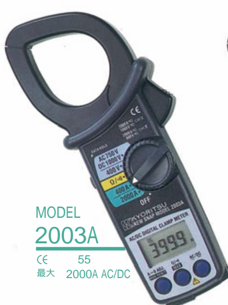
MODEL 2003A CE 55 最大 2000A AC/DC